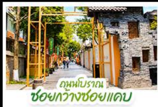
ถนนโบราณ ชอยกว้างชอยแคบ