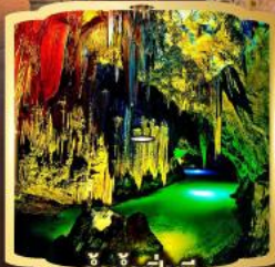
ถ้ำน้ำเป็นซี