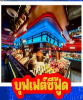
บุฟเฟต์ซีฟู้ด