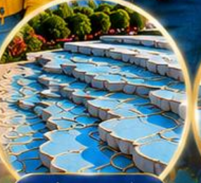
ปานุกคาล์ Pamukkale