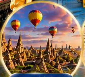
เมืองคปปาโดเกีย Cappadocia