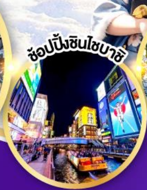
ช้อปปิ้งชินโซมาชิ