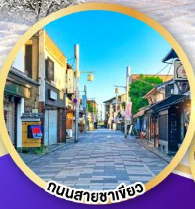
ถนนสายชาเขียว