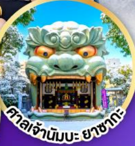
ศาลเจ้ามิมะ ยาชากะ