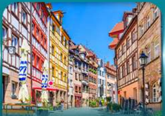
เที่ยวเมืองเก่าบูเรมเบิร์ก