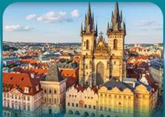
ชมปราสาทปราศ ย่านเมืองเก่า