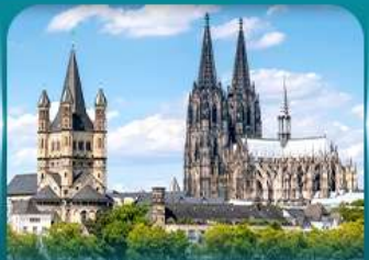
เซ็คจินมหาวิหารโคโลญ