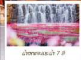
น้ำตกทะเลสาบไห่ 7 สี

🗳️ โหลด 23 KG. x1 ทั้งไป - กลับ ✓ ฟรีมัชมัทัวร์ ✓ ไม่เข้าร้านรัฐบาล ✓ ทิวทัศน์แปลก ✓ รวมค่าเข้าชมสถานที่ตามโปรแกรม