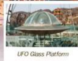
UFO Glass Platform