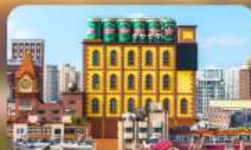
โรงงานเบียร์ซิงเต๋า