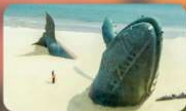
ประติมากรรมวาฬโดดเคี้ยว