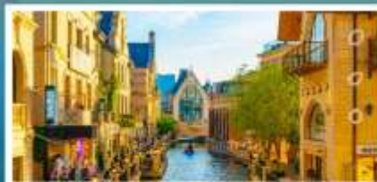
เมืองน้ำเวนิสตะวันออก