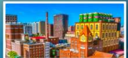
โรงงานเบียร์ซิงเต่า