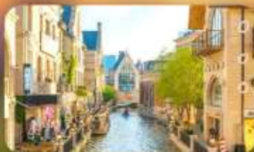
เมืองน้ำเวนิสตะวันออก