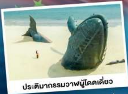
ประติมากรรมวาฬไคโดเคียว

เที่ยวเมืองชายทะเลโอปิตีตี ซิงเต่า - ต้าเหลียน - ฉะจีงไถ่