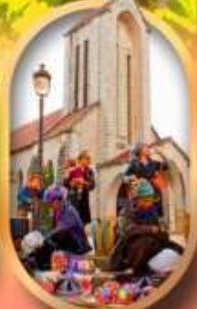
โบสถ์หินซาปา