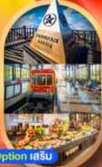
Option 1 เสริบ