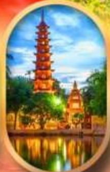
วัดเงินทิวทอง