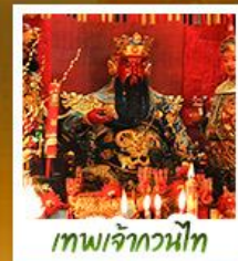
เทพเจ้ากวนไท