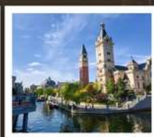
เมืองเวนิสแห่งต้าเหลียน