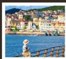
อ่าวหลงเจียง