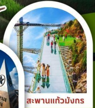
สะพานแก้วมิงทง