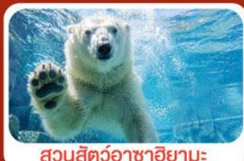
สวนสัตว์อาซาฮิยามะ