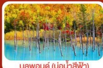
บลูพอนด์ (บ่อน้ำสีฟ้า)