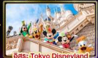
อิสระ Tokyo Disneyland