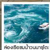
คลองเรือขมบ้านนาสุโตะ

วัดบึงขออน / ตลาดกึ่งง / โบสถ์โกะทาวน์ (จุดชมวิว) / สะพานคินไตเคียว เกาะมียาจิมา ศาลเจ้าอิตสึคุชิมะ / สวนอนุสรณ์สันติภาพฮิโรชิมา โดโกะออนเซ็น / ถนนโอโมเตะซันโด คมปีระซัง / ปราสาทัตสึยามา กิจกรรมทำเส้นอุด้ง / สวนริทสึริน / สถานีรับทางคุรุคุรุมารุโตะ คลองเรือขมบ้านนาสุโตะ / ซุปบึงย่านชินโซบาช / ตลาดปลาคุโรเมง / ซุปบึงย่านอุมาเดะ