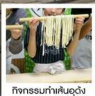
กิจกรรมทำเส้นอุด้ง