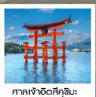
ศาลเจ้าอิตสึคุชิมะ