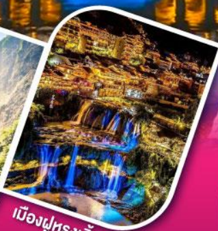
เมืองฝูหลงเจิ้น