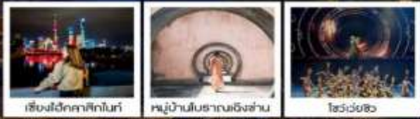
เซียงไฮ้คลาสสิกไนท์